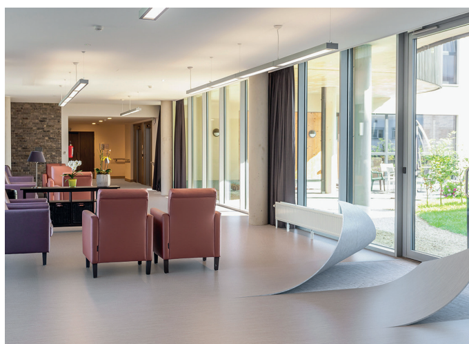
« Modul'up » est le premier lé de vinyle adapté à la pose sans colle et aux projets spécifiques à être proposé sur le marché depuis 2017.

Forbo propose même des lames et des dalles dont seuls les bords sont aboutés, et ce, sans jointoiment. La gamme comprend par ailleurs un revêtement en lé, « Modul'up », qui convient également aux projets sans fixation au support, mais avec des bords soudés. Forbo distingue notamment des produits à pose libre les dalles de vinyle « Allura Flex », qui requièrent une fixation adhésive. Il en est de même pour les dalles et les lames de la collection « Allura Dryback », qui peuvent être appliquées selon le procédé de collage à sec, ou pour les lés de linoléum qui sont fermement fixés au support avec des colles humides.