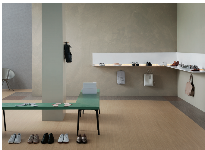
Les dalles et lames de linoléum « Marmoleum Click » offrent une grande rapidité et facilité de pose sans colle.